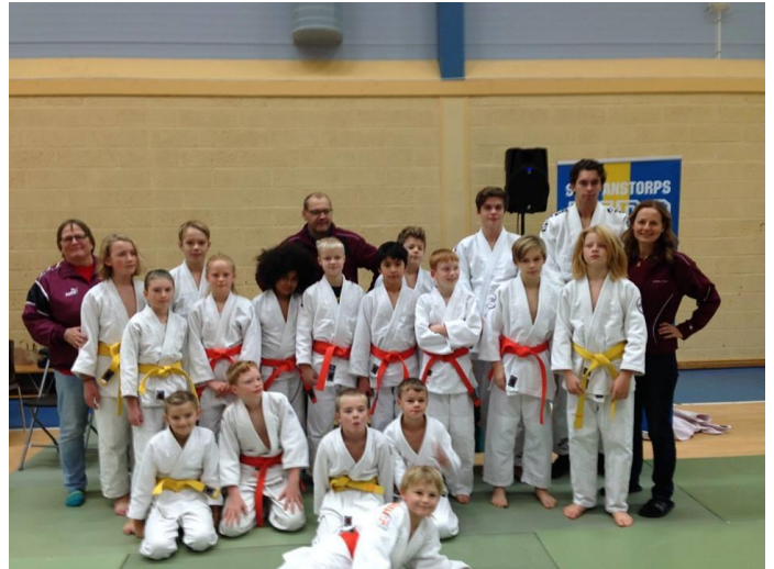
Här poserar nästan alla Lugideltagarna från Syd Cupen.

LUGI Judo kom totalt på en tionde placering.